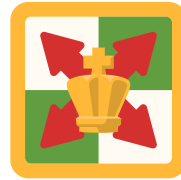
Actividad del Rey en el Final