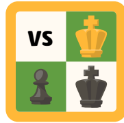
Rey y Peón Contra Rey