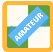
Juego de ataque: la mejor partida Amateur