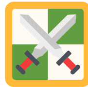
Un Ataque Brillante