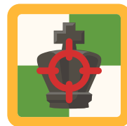
How To Hunt A King