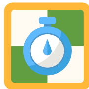
How To Develop With Tempo